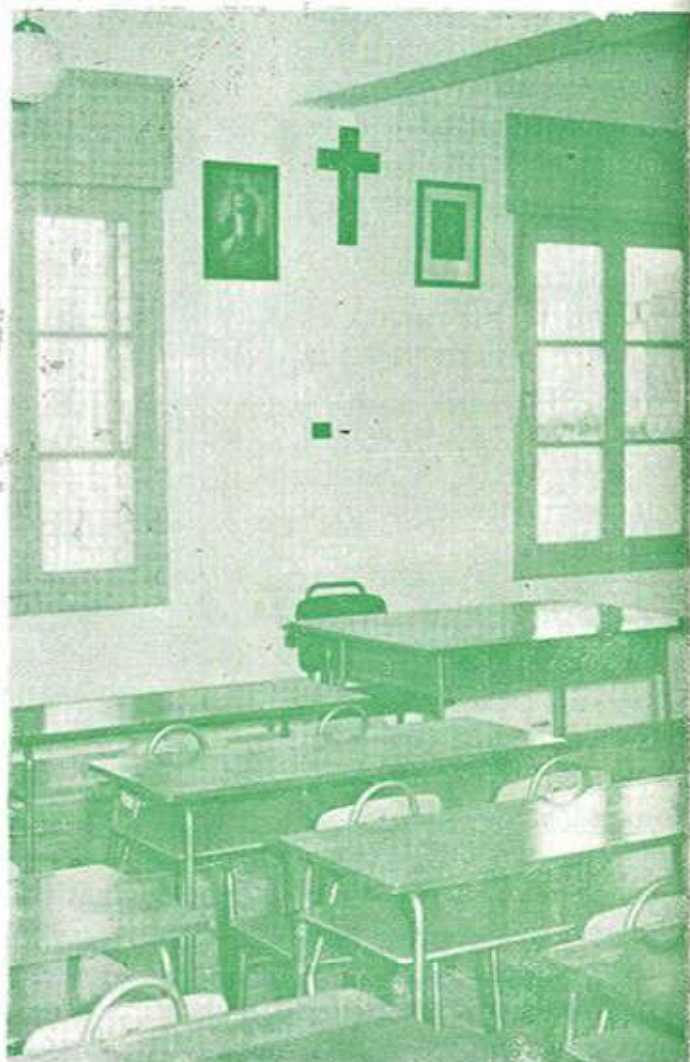
Interior de una de las clases del Grupo Escolar «Jorge Juan».

Confiar en la colaboración de todos para alcanzar un alto nivel educativo ha sido siempre nuestra norma, fiados en la seguridad de que Novelda sabe que su bienestar no ha de venir de fuera. El mejoramiento moral y material de la ciudad se ha de alcanzar por nuestro trabajo y hoy no hallará compensación a su esfuerzo aquél que no se capacita, prepara y ejercita desde su más tierna edad. La vida es lucha y nuestros tiempos exigen cada vez